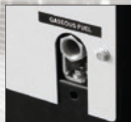
Ingresso Gas. Gas inlet.